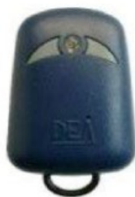
GENIE - R 2 touches grises