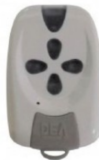
Moi - TR Bas de la télécommande gris