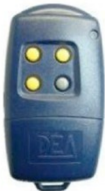
GOLD - R Touches jaunes et 1 grise

Concerne les télécommandes DEA, sans mini-interrupteur de codage avec ces boîtiers :